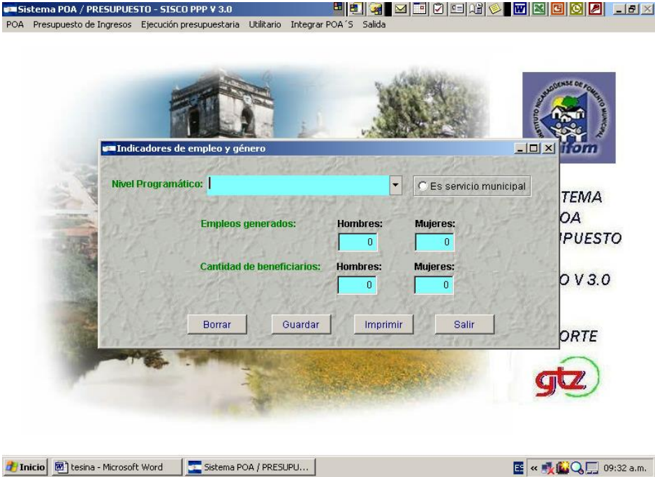
Registro de ejecución financiera por programas/proyectos por sexo